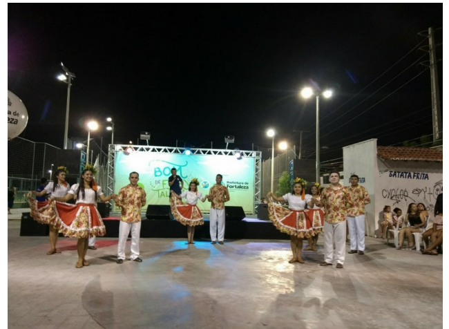
Estúdio TV Diário – Especial – Grupo de Tradições Folclóricas Raízes Nordestinas