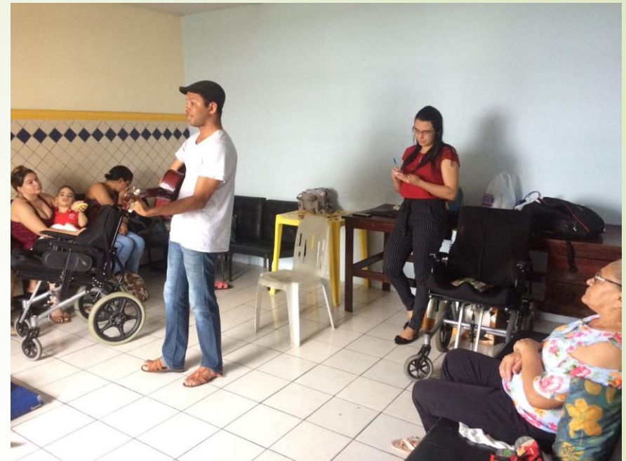
Oficina na APAE