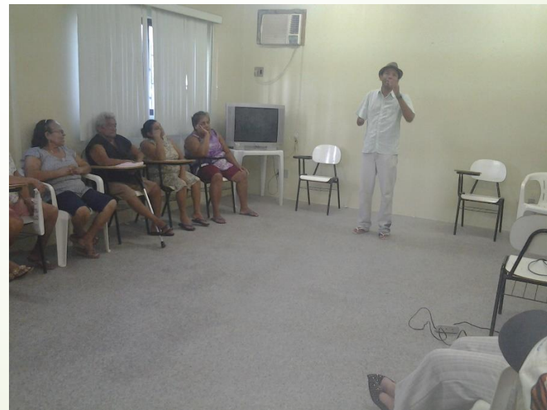
Recitação de Cordel - PSF