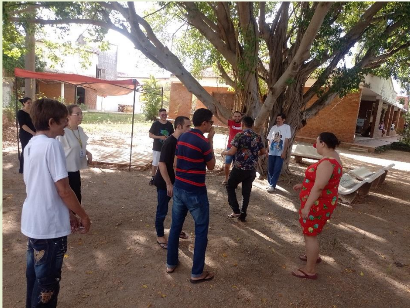
Oficina no CAPS