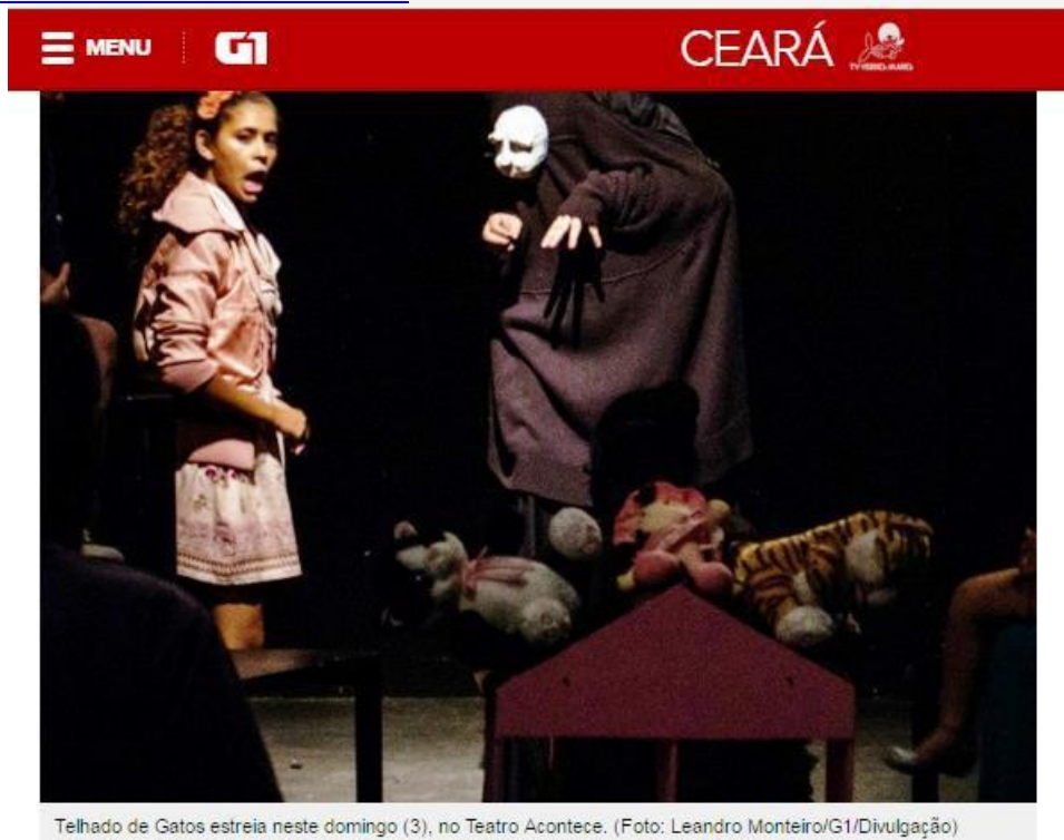
Telhado de Gatos estreia neste domingo (3), no Teatro Acontece.

DISPONÍVEL EM: http://g1.globo.com/ceara/noticia/2016/04/pagode-reggae-e-forro-estao-entre-atracoes-do-fim-de-semana-no-ce.html