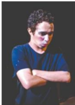
“Além de uma peça infantil”: menos clichês, mais descontração

Em “Além de uma peça infantil” os personagens estão sempre em conflito com o narrador e tentam fugir dos clichês dos contos infantis, para que assim possam criar uma peça infanto-juvenil original, com final sur-