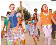
O curso de teatro é realizado em quatro municípios do Interior

► No Interior, o curso é realizado a partir de parcerias com a Secretaria da Cultura (Secult).