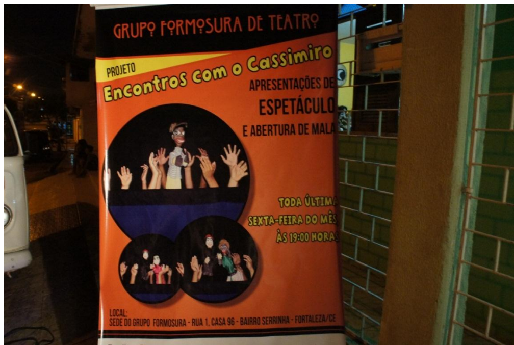
foto do banner 1