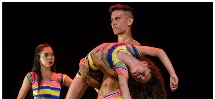
"Travessia" é a dança que reflete sobre a periferia

Depois do teatro de rua, tem dança no Teatro Dragão do Mar. Às 20h das quintas-feiras deste mês, os bailarinos do Stúdio Katiana Pena tomam o palco e encenam "Travessia", pela programa Quinta com Dança. A montagem é uma reflexão sobre a vida urbana de periferia sob a ótica de quem está à margem, sem necessariamente ser "marginal". Leva à cena as contradições de um sistema que faz sofrer homens e mulheres pobres. Os ingressos custam R$ 10 e R$ 5 (meia) e estão à venda na bilheteria do Teatro, que funciona de terça a domingo, das 14h às 20h.