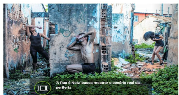
JOC 'A Rua é Noiz' busca mostrar o cenário real da periferia

Nossa periferia é nosso cenário real e simbólico e nosso enredo é nossa gente e nossos lugares de cada dia. Queremos dar conta de nós mesmos, nos revelar e desvelar aquilo que nos define. O espetáculo se propõe a trazer cenas da realidade de quem vive no Grande Bom Jardim. Às 18h30, no Centro Cultural Bom Jardim (R. Três Corações, 400, Bom Jardim). Gratuito. (3497.5991)