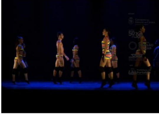
Espectáculo Travessias, do Studio de Dança Katiana Pena.