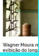
Wagner Moura re exibição de longa