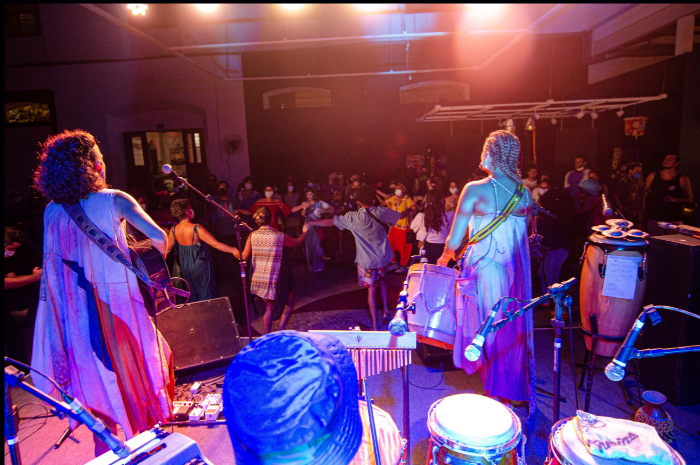
Festival Elos - 2021