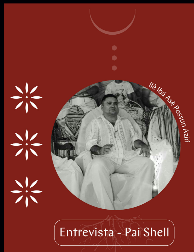
Entrevista - Pai Shell

Para assistir as entrevistas, clique nas imagens