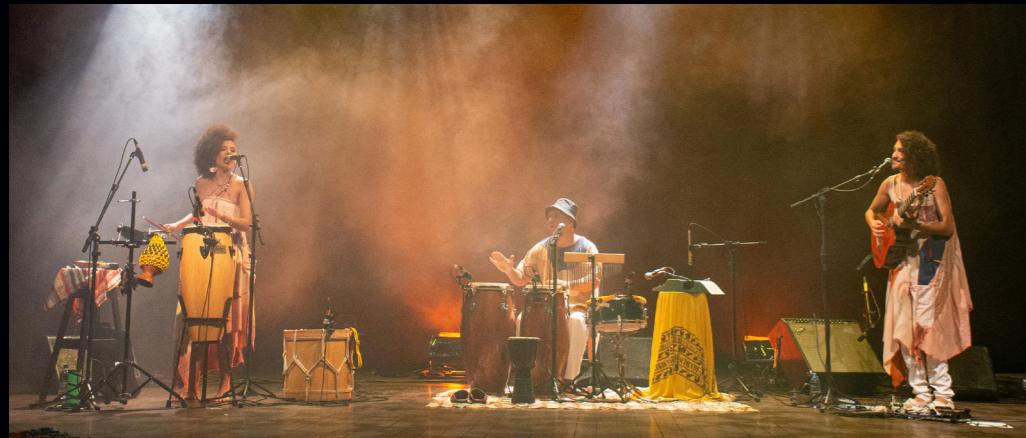
Teatro Dragão do Mar - 2021