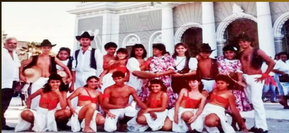
Grupo Folclórico 25 de Março – Redenção Ce