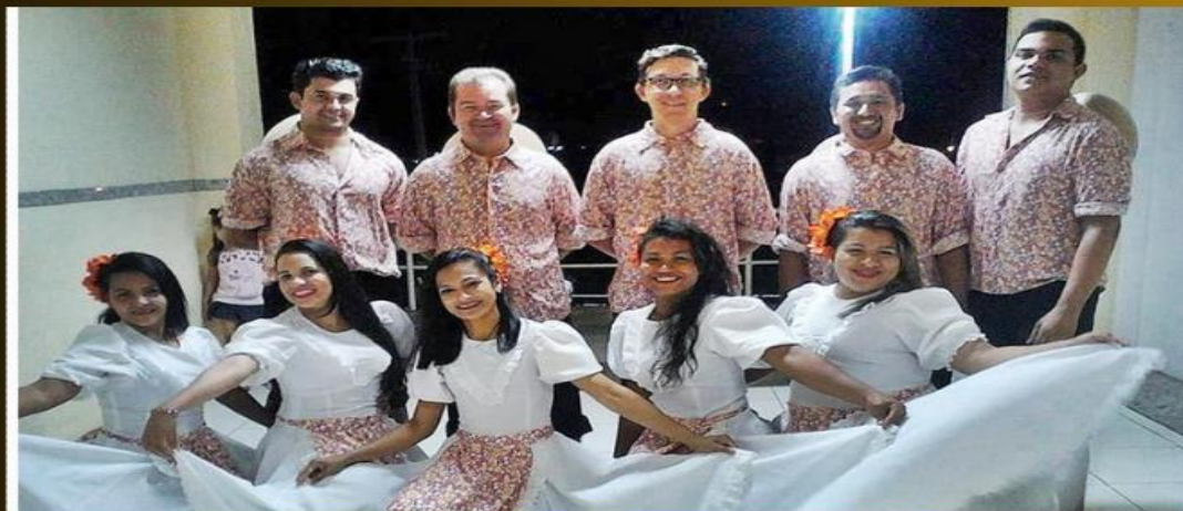
Quarta Cultural Unilab 2016