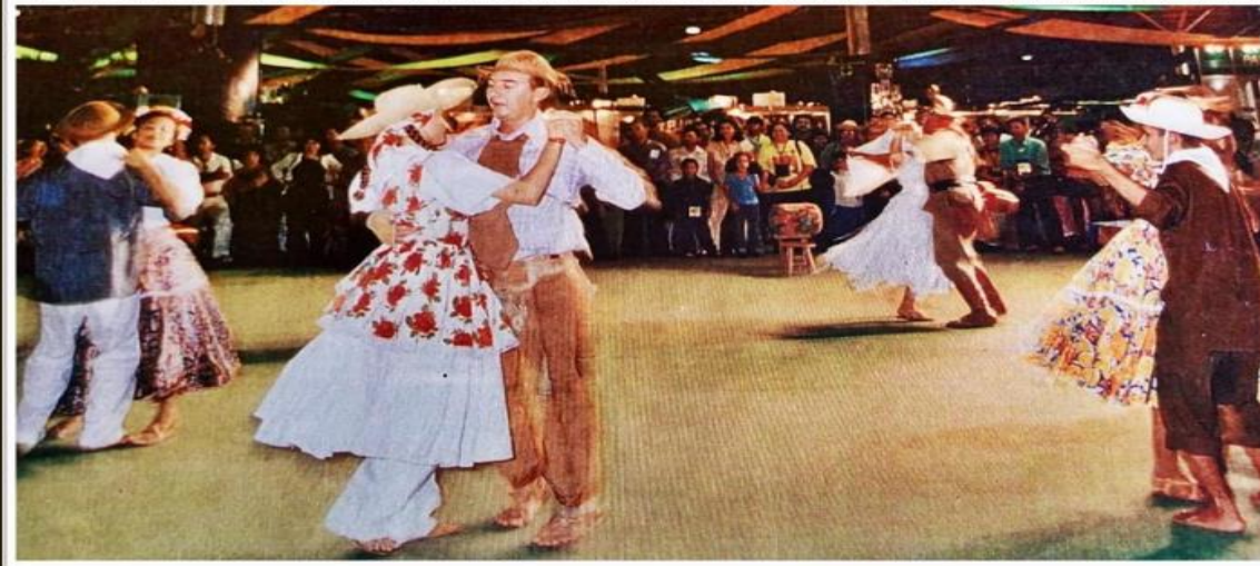
Grupo Folclórico 25 de Março, de Redenção Ce, em Brasília DF, Lançamento do Programa Nacional de Municipalização do Turismo. 2001