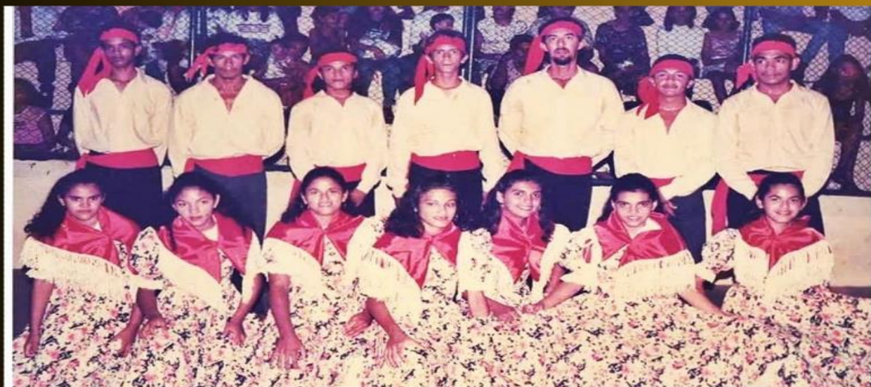
3a Geração do Grupo Folclórico 25 de Março 1994