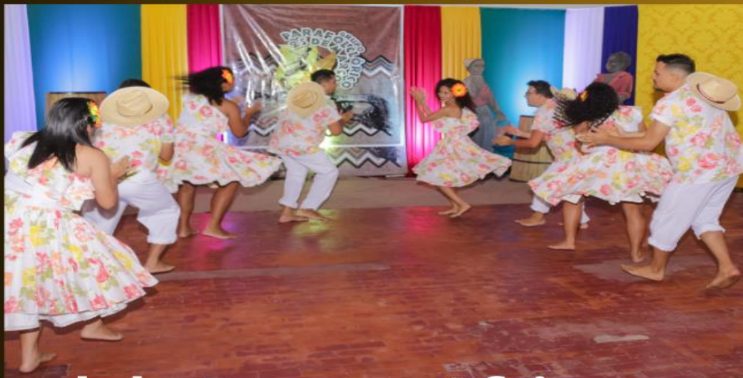
I Festival de Danças Africanas e Afro- Brasileira 2021