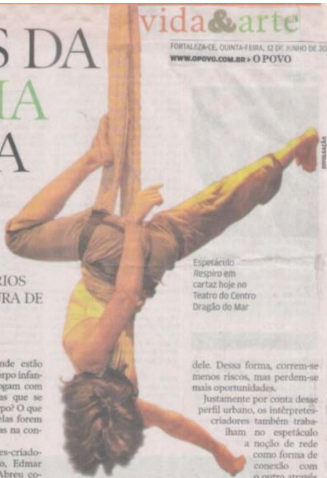
Espectáculo Respiro em cartaz hoje no Teatro do Centro Dragão do Mar