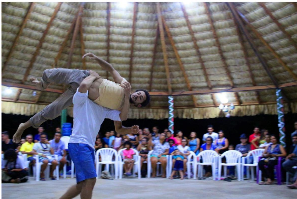
Projeto Palafita Imersão no sagrado Indígena – 2017- 2018