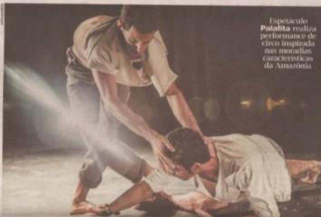
Espectáculo Palafita realiza performance de circo inspirada nas narrativas características da Amazônia

Em Palafita, duas pessoas buscam equilíbrio para resistir à imagem das palafitas com estratégia de habitar um espaço. A morada cria a sustentabilidade da presença, uma missão de habitar no terreno não estável da condição humana. "Utilizar o corpo como ferramenta é algo que nos permite transgredir uma narrativa linear. Em Palafita, não há cenário ou final, suas condições temporais são relacionais e dependentes mesmo do olhar e do narrador que se firma em cada indivíduo que assiste à obra. Trazer o corpo como dispositivo, muitas vezes é permitir que o outro crie suas próprias conexões com