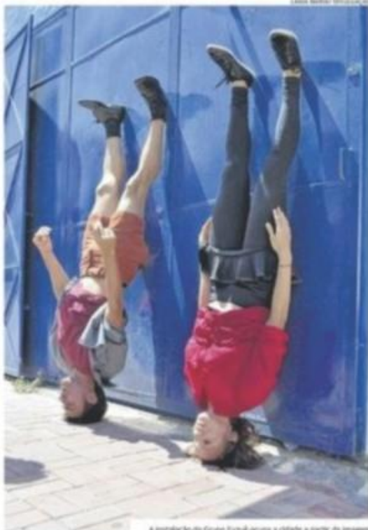
A instalação do Grupo Fuzuê ocupa a cidade a partir da imagem

Quando: hoje e na próxima quinta, a partir das 10h, onde: ruas do Centro de Fortaleza (ruas no cruzamento da avenida Duque de Caxias e rua Barão de Itapicuma). Outras info: 3252 8996 / edmarcandido@gmail.com / fuzuegrupo@gmail.com