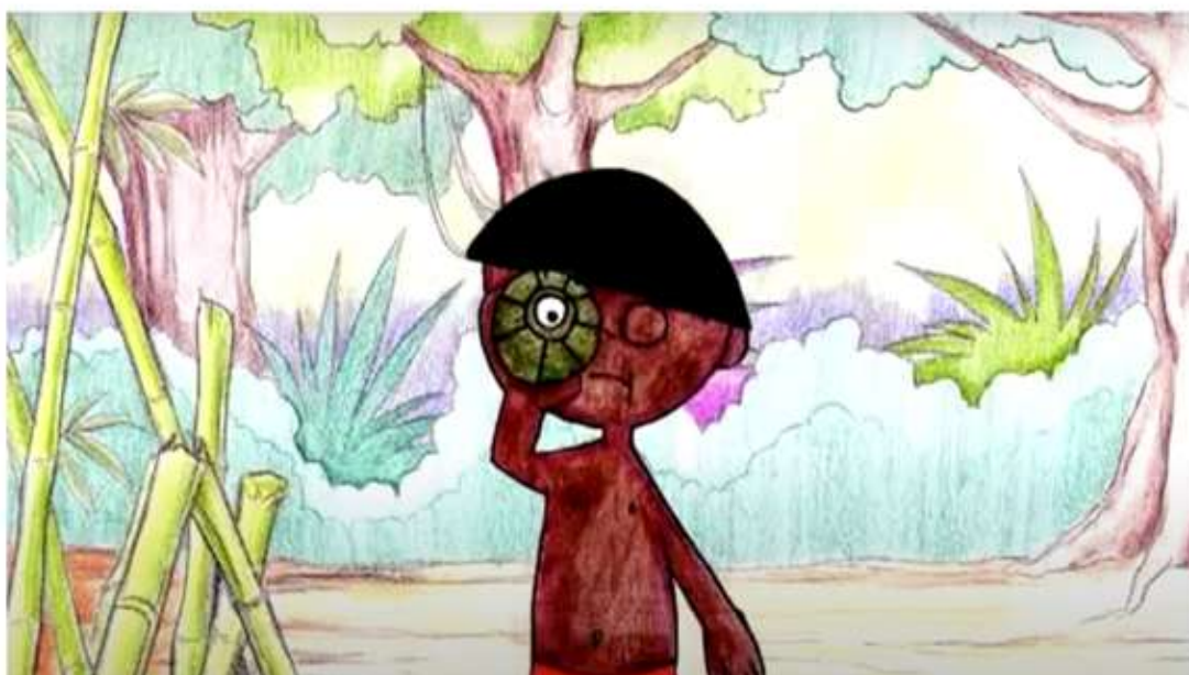
Legenda: "O Som da Floresta", uma produção coletiva Casa Amarela, será transmitida hoje na programação do Cine Pólo

Exibição de curtas-metragens e contação de histórias em libras acontece gratuitamente pelo Canal do YouTube Cinemul do Ceará