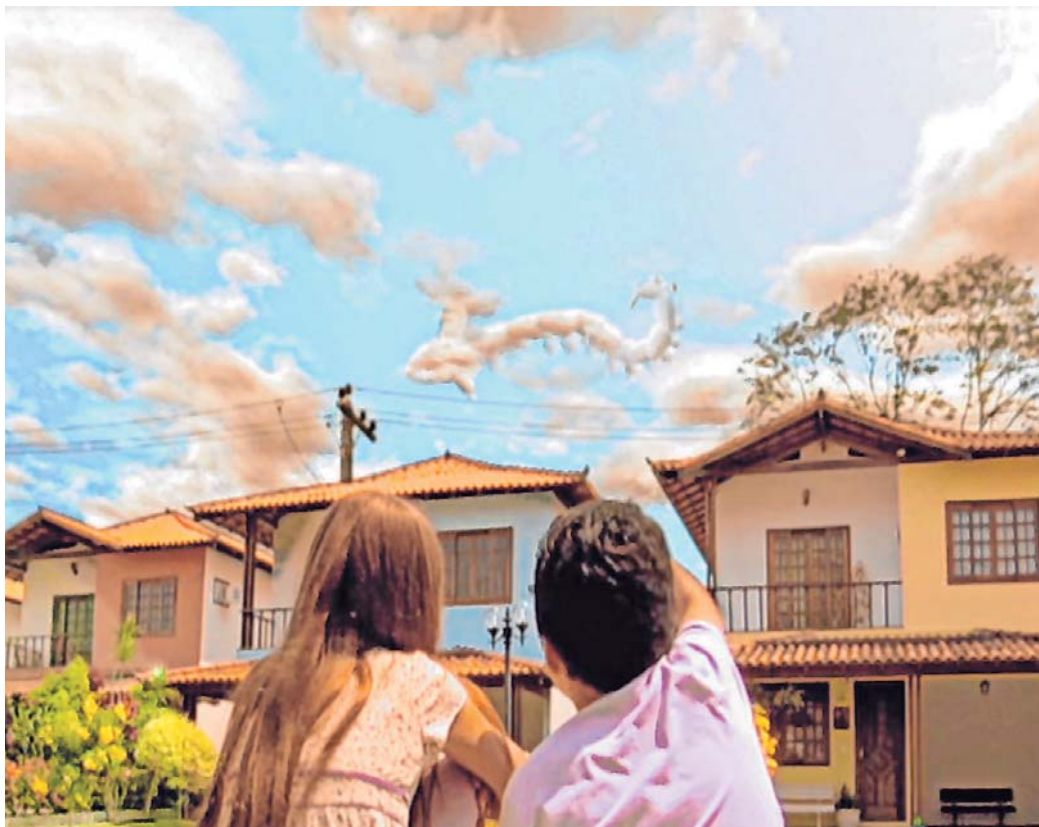
“Mãos de Vento Olhos de Dentro”, de Susanna Lira, também está na seleção da Mostra

Programação on-line: 17 curtas-metragens disponíveis até o dia 5 de fevereiro de 2021 no canal da Invento Produções Culturais no YouTube. (3048-6077)