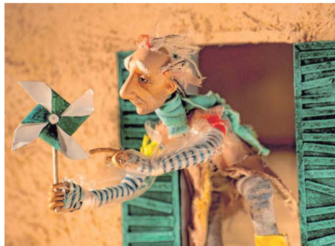
“My Strange Grandfather”, de Dine Veliskovkaya (Rússia, 2011)