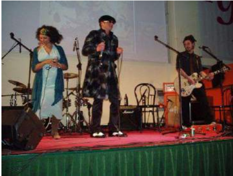
MARGUERA VLILLAGE / Itália 2009