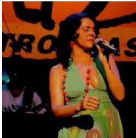
Centro Cultural BNB Fortaleza 2008