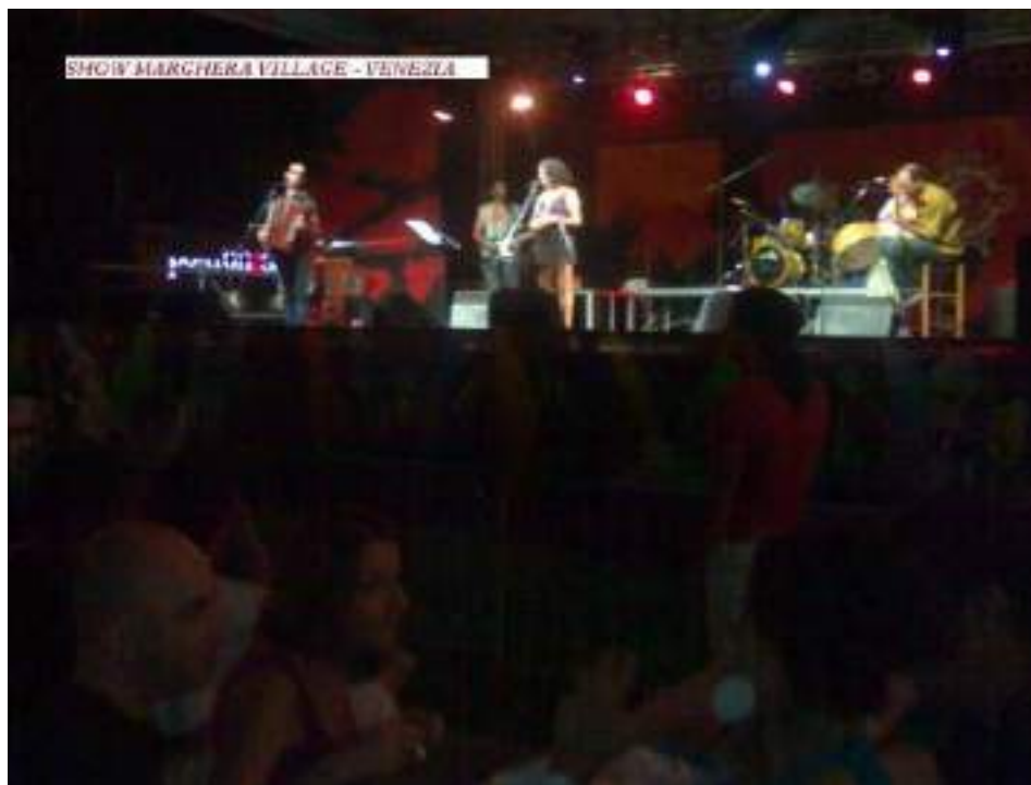
2009 interpretando Asa Branca - Luiz Gonzaga

https://www.youtube.com/watch?v=f307b5kpa2k&index=23&t=0s&list=PLB934IPR-UvsSwSN1gmqd3MWmvNTQf7uT