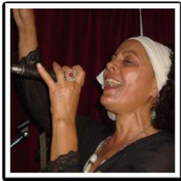
MACONDO PUB em BOLONHA / IT