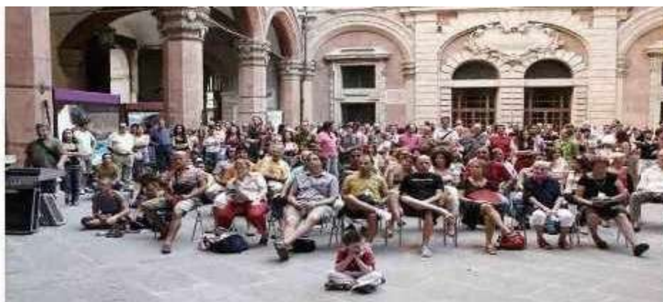
Palazzo d'Accursio - Centro histórico de Bolonha/Itália, abrindo o show de Gil.