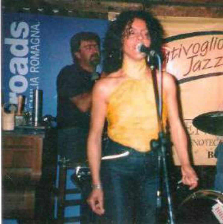
FESTIVAL CROSSROADS em catina BENTIVOGLIO, BOLONHA / IT.