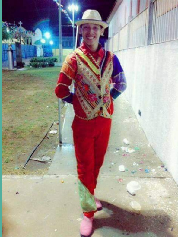
Projeto junino-dançando a tradição- 2015