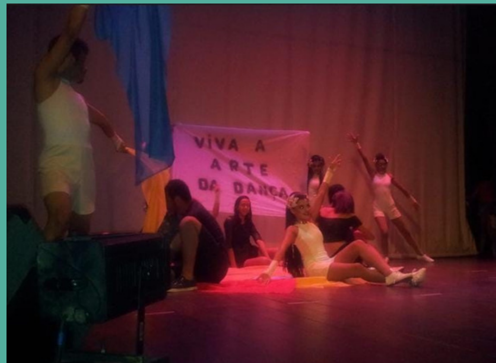
Espectáculo de dança- A Arte da dança 2018