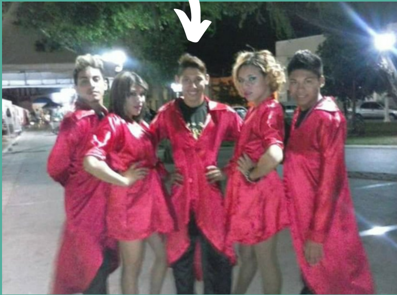
Grupo Mistura de Ritmu' s- 2011