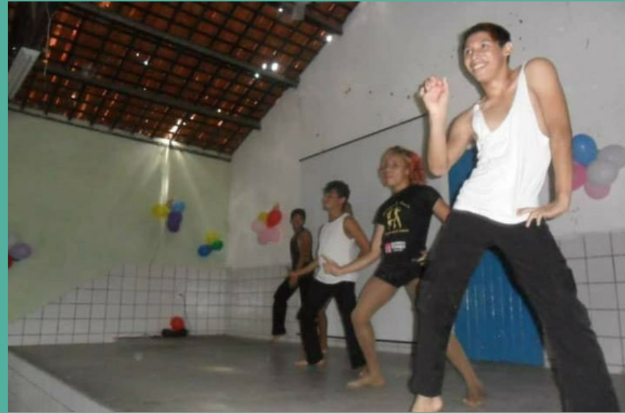
Apresentação do Grupo Mistura de Ritmu's 2010