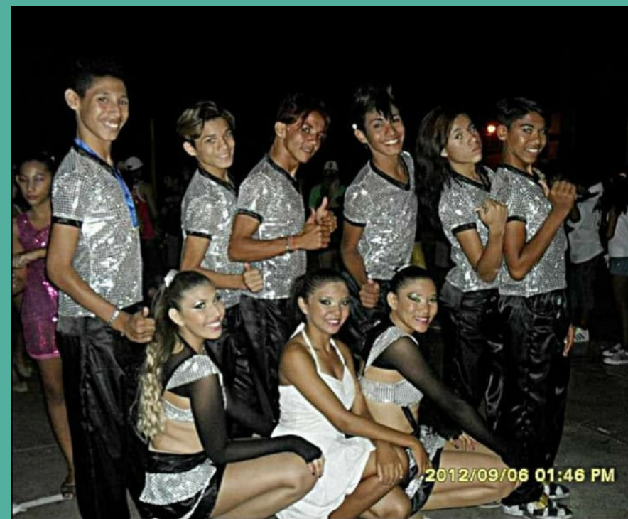
Grupo Mistura de Ritmús- Apresentação na quadra da comunidade- 2012