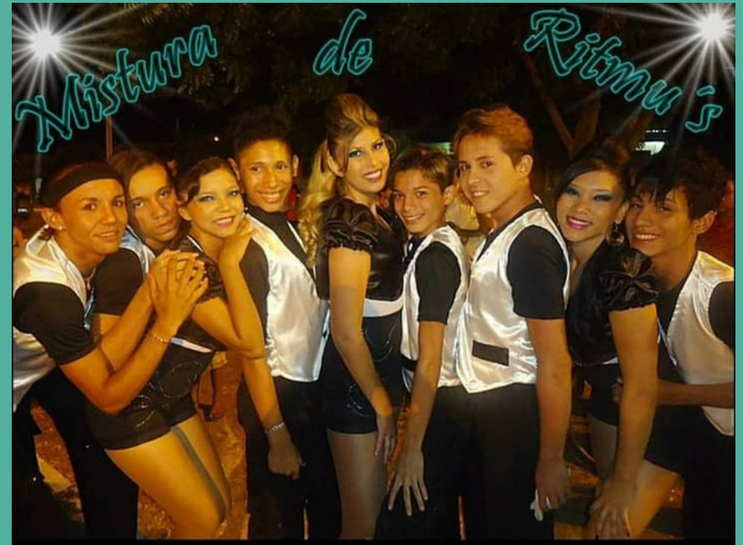
Grupo Mistura de Ritmu's Espetáculo de dança- Rádio- 2014