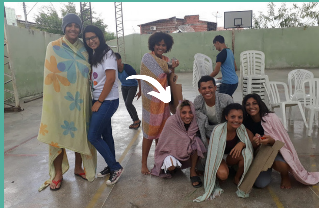
Apresentação de Peça teatral na Escola 2016