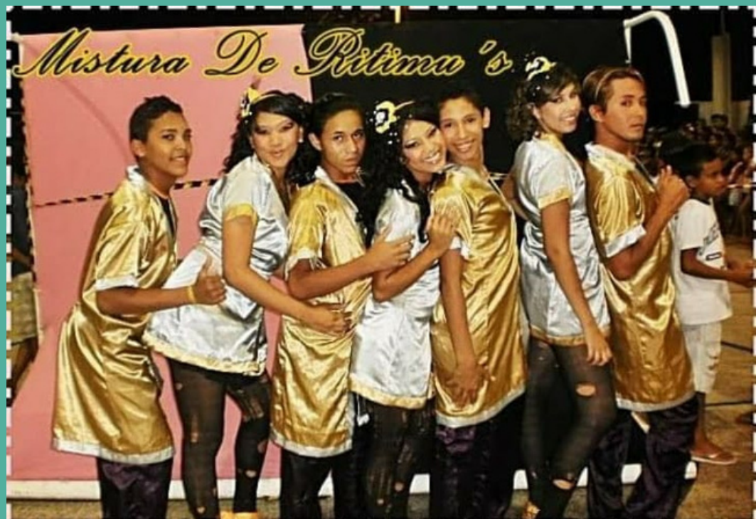
Grupo Mistura de Ritmús- 2013