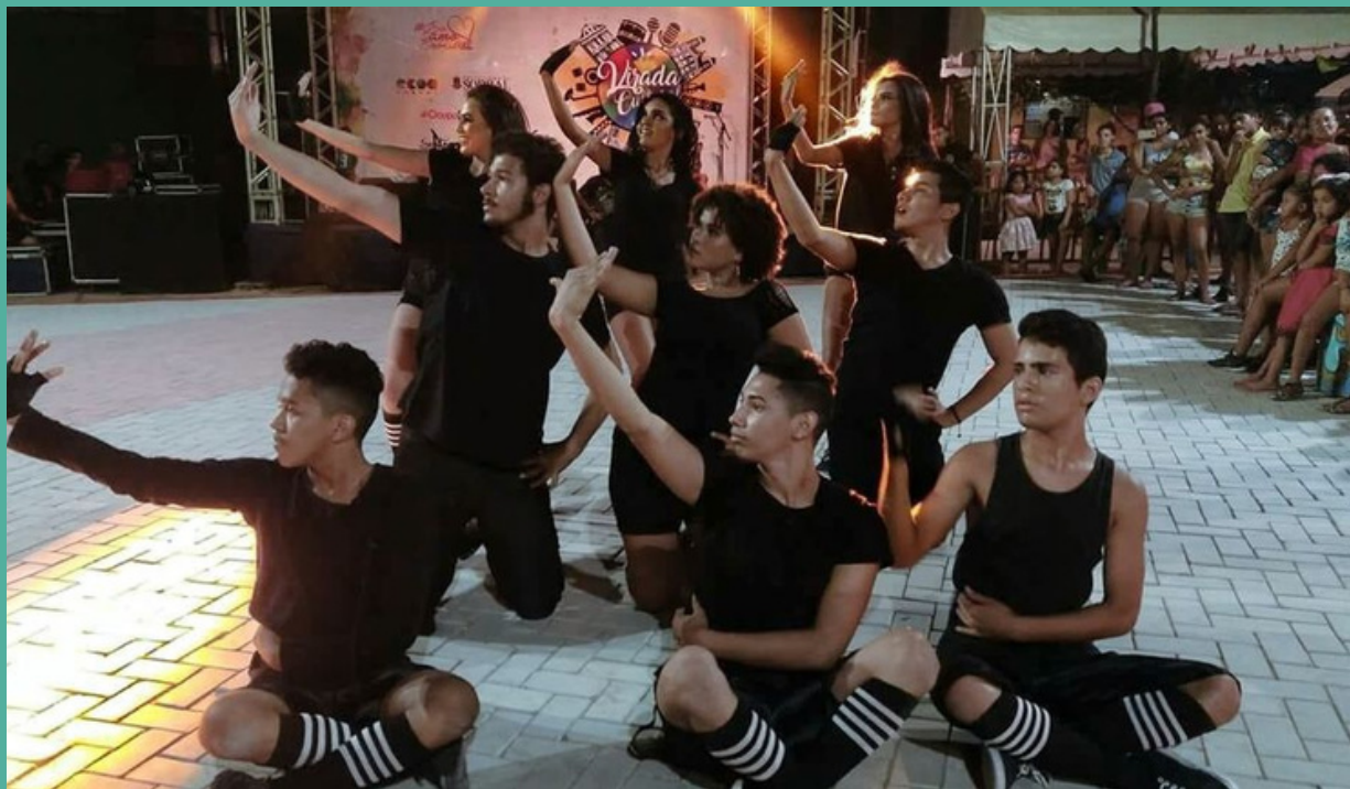
Participação na programação Virada Cultural 2017