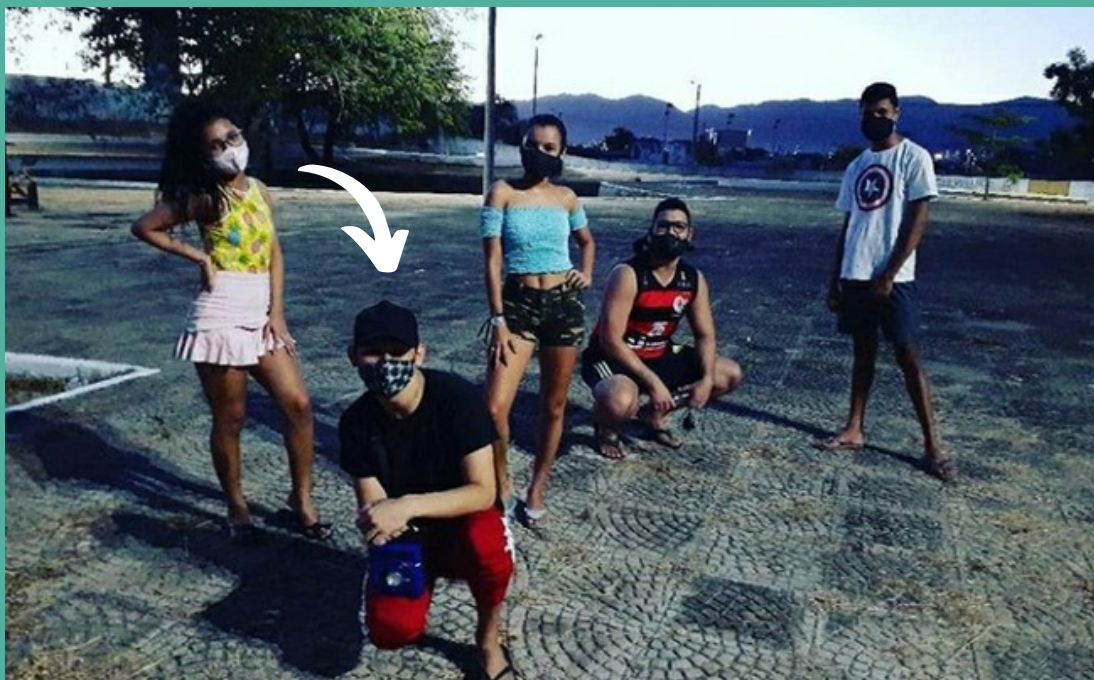
Apresentação para A'Gosto das Juventudes- SECJEL 2020