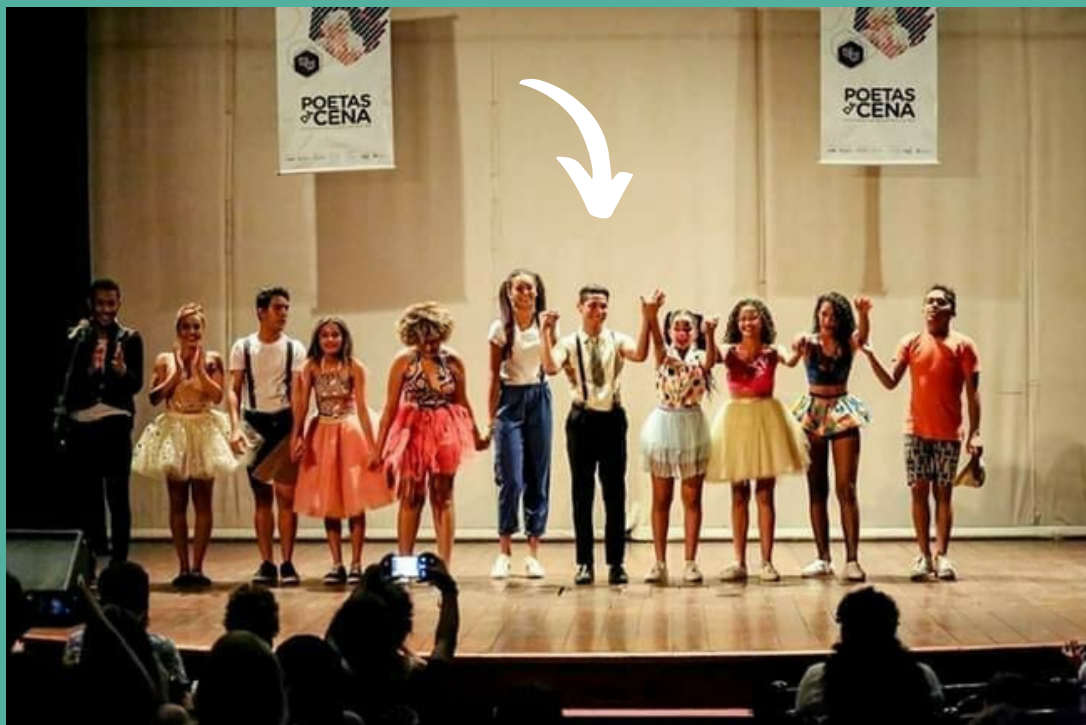
Editais Poetas da Cena- ECOA Sobral- 2018