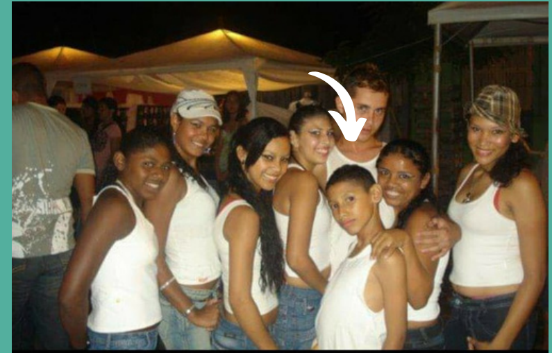
Grupo Mistura de Ritmu's- 2009