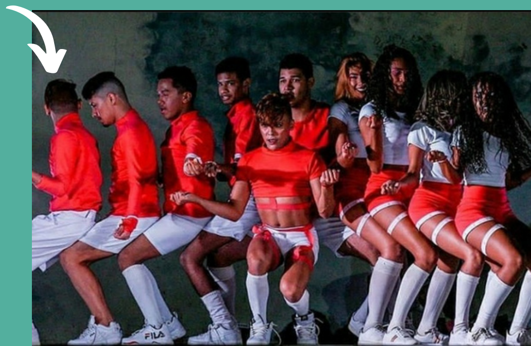
Festival de Danças Urbanas 2019