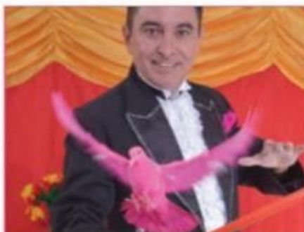
Cartola Mágica Eflém Gonçalves, em parceria com o Projeto Arte em Cena | SESC Circo · Livre · 45min BARRA: SEX 31, 18H30, PÁTIO