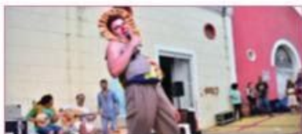
O Jacá do Caburé Grupo Cabeça de Sol (MA/PI) Circo · Livre · 50min JANGURUSSU: QUA 22, 19H