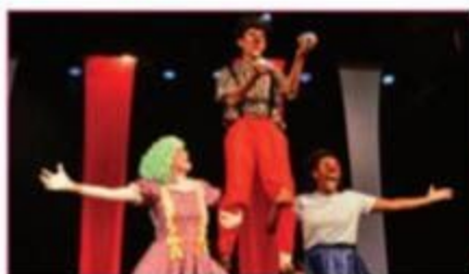
Matilda, a boneca medrosa Grupo Avia de Teatro, em parceria com o projeto Arte em Cena | SESC Circo · Livre · 45min JANGURUSSU: QUI 30, 15H, PÁTIO