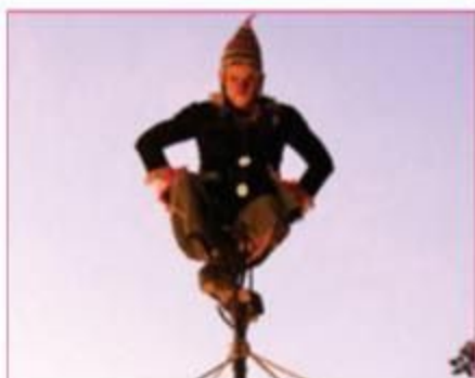
Inka Clown Show Cia Camarim de Teatro Circo · Livre · 50min BARRA: SÁB 25, 18H30, PÁTIO