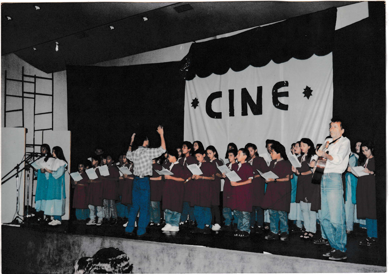
CORAL DE SANTANA DO CARIRI NA ABERTURA DO I FESTIVAL DE ARTES CÊNICAS MEMORIAL PE. CÍCERO - JUAZEIRO DO NORTE-CEARÁ.