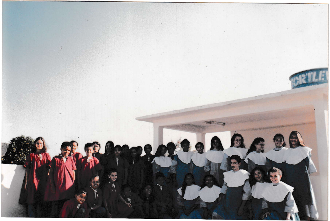
CORAL ADULTOS VOLUNTÁRIOS E CORAL ESTUDANTIL INFANTIL DE SANTANA DO CARIRI.