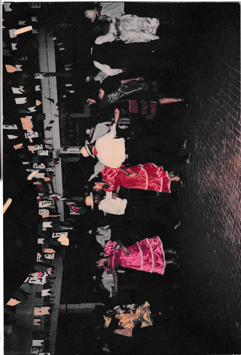
QUADRILHA FESTIVAL JUNINO