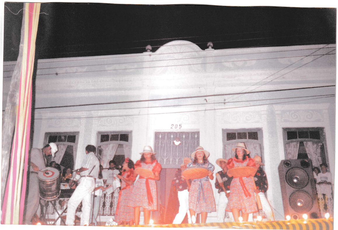
APRESENTAÇÕES FOLCLÓRICAS NO DIA DO FOLCLORE 22 de agosto de 1999