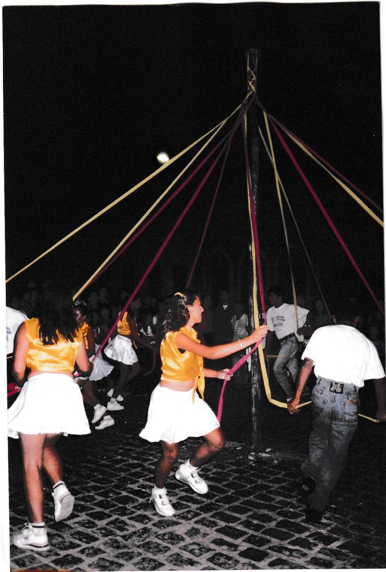
PAU DE FITA