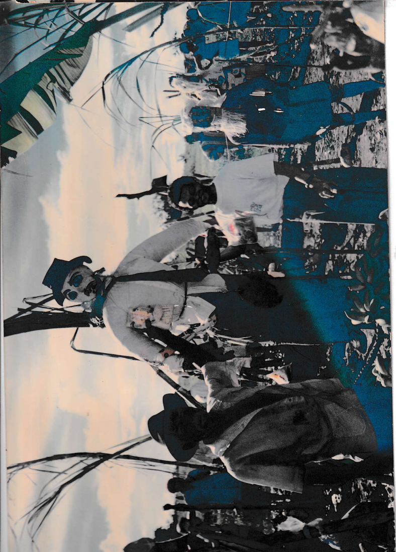
MALHAÇÃO DE JUDAS