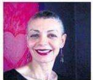
Jane Malaquias é realizadora e diretora de