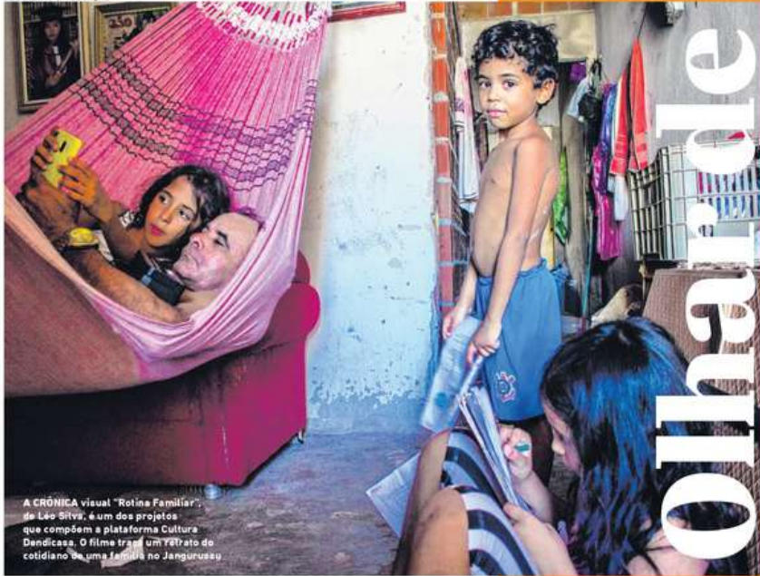
A CRÔNICA visual "Rotina Familiar", de Léo Silva, é um dos projetos que compõem a plataforma Cultura Dedicada. O filme trata um Yêtuato do cotidiano de uma família no Jangurusu.

JOÃO GABRIEL TREZ joaogabriel@opovo.com.br