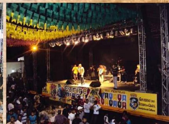
Palco montado para apresentação das bandas, no XIII Festejo Cariré Junino