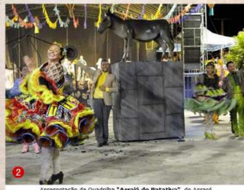
Apresentação da Quadrilha "Arraiá do Patativa", de Assaré