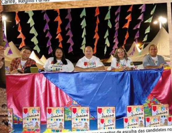
Corpo de jurados da Fequajuce, votou nos quesitos de escolha das candidatas no 10º Cariré Junino de 2018