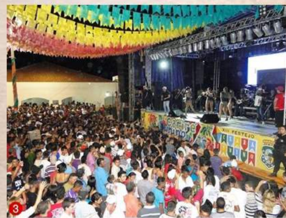
Grande público compareceu à praça da Prefeitura Municipal, para prestigiar a renomada Banda Forró Sacode

10º CARIRÉ JUNINO 2016 "SÃO JOÃO, RAIZ E TRADIÇÃO."