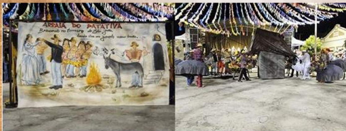
Quadrilha Arraiá do Patativa fez apologia ao jumento, com o tema: " Brincando no terreiro de São João, dando viva ao jumento nosso irmão ", em homenagem aos 100 anos de nascimento de Luiz Gonzaga, o "Rei do Baião"