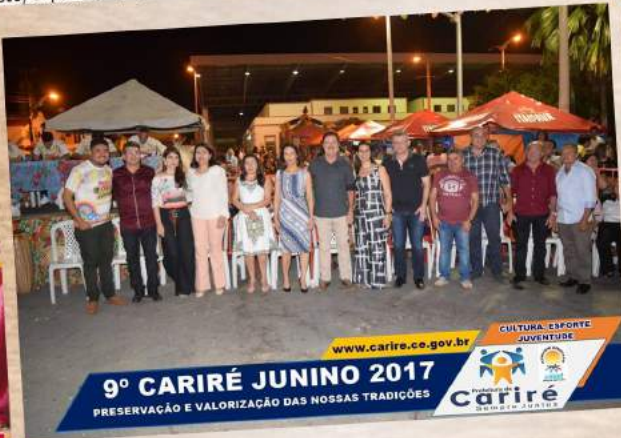
www.carire.ce.gov.br 9º CARIRÉ JUNINO 2017 PRESERVAÇÃO E VALORIZAÇÃO DAS NOSSAS TRADIÇÕES CULTURA ESPORTE JUVENTUDE Cariré CERAMICA JUNINA