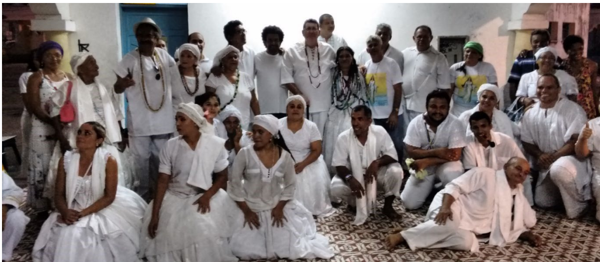
Dia Nacional da Umbanda realizada no Parque das Crianças, em 2015.