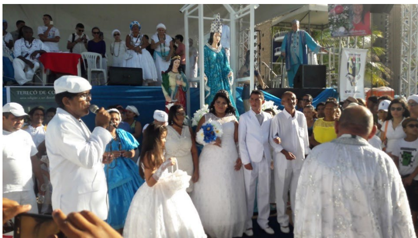
Realização de casamento Umbandista Praia de Iracema, Festa de Iemanjá, 2017.