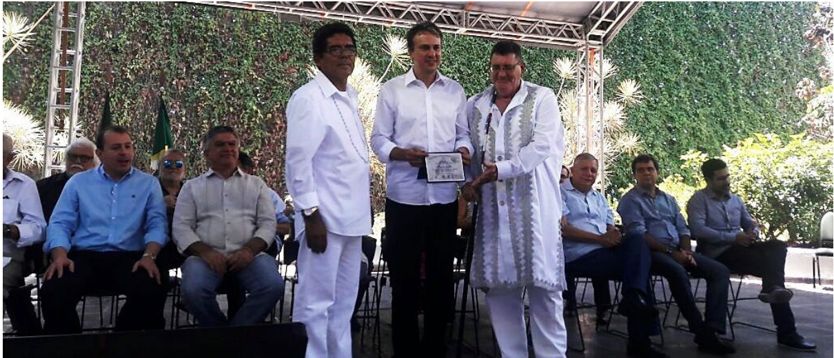
Dia Nacional da Umbanda realizada no Parque das Crianças, no Centro de Fortaleza, no dia 15 de novembro de 2016.