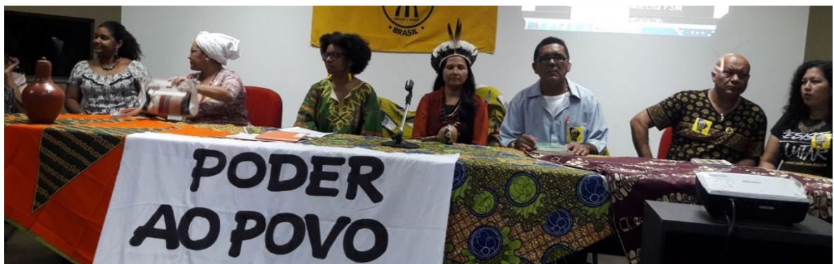
Reunião da Marcha Contra o Racismo, realizada em 2018.