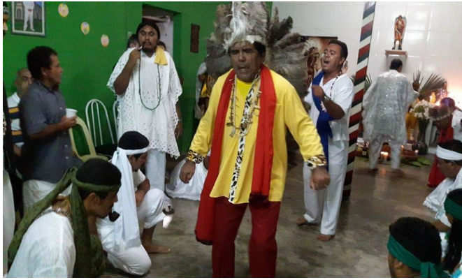
Festa do Seu Rei dos Índios no Centro Espírita de Umbanda São Miguel, realizada em janeiro de 2017.