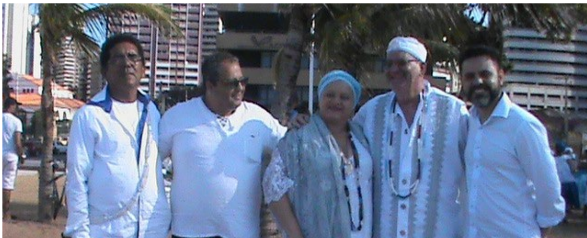
Festa de Iemanjá 2016 no Aterro da Praia de Iracema.