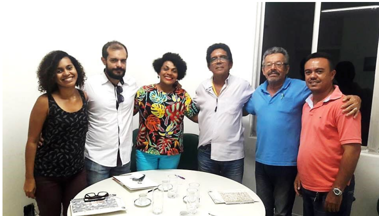
Reunião na CEPPIR - CE Coordenadoria Especial de Política de Promoção de Igualdade Racial do Estado do Ceará sobre a Festa de Iemanjá 2017.