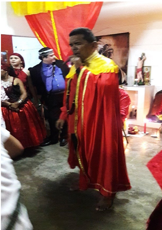
Festa do Seu Tranca Rua, realizada no Centro Espírita de Umbanda São Miguel, 2017.