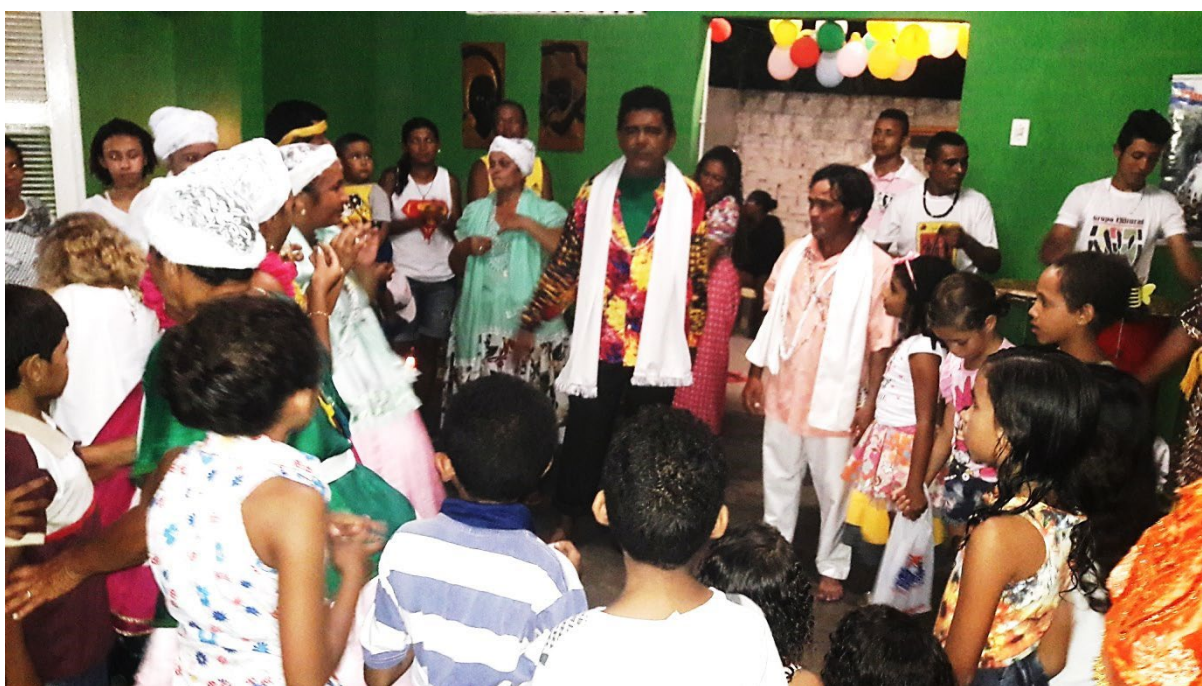
Festa das crianças no Centro Espírita de Umbanda São Miguel, realizada em setembro de 2016.