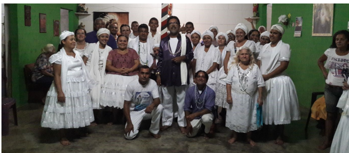
Gira tradicional na Quaresma/ 2016.