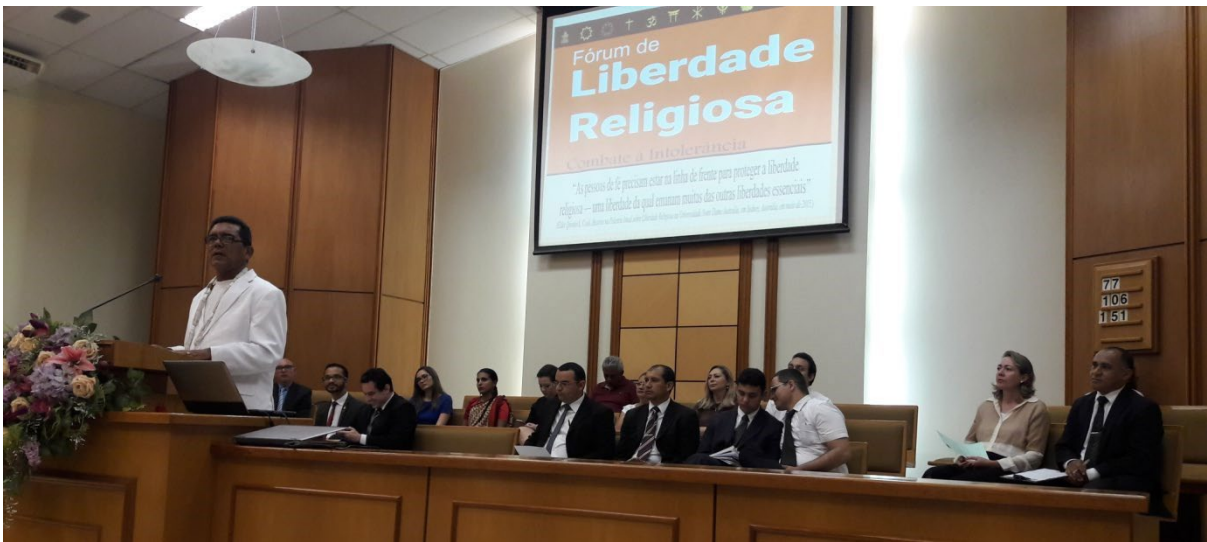
Fórum de Liberdade Religiosa, Igreja de Jesus Cristo dos Santos dos últimos Dias/ Estaca Bom Jardim/ em junho de 2017.