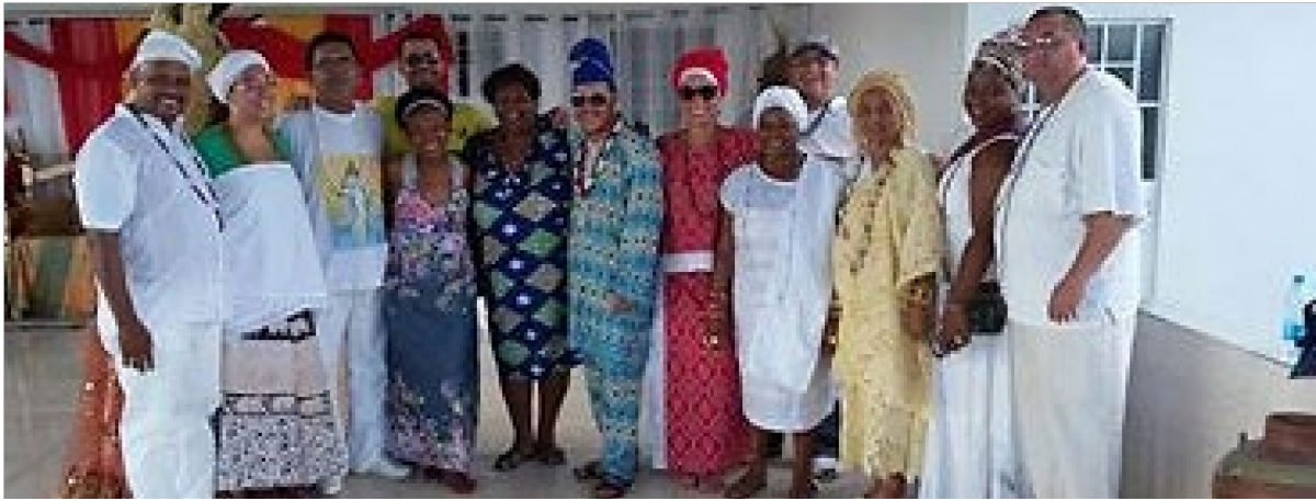
Conselheiros do CNPC - Colegiado Nacional do Patrimônio Cultural, Pernambuco/ 2015