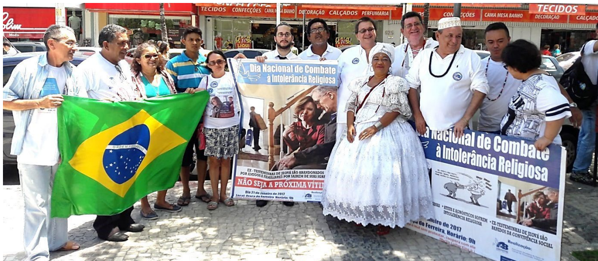
Dia Nacional de Combate a Intolerância Religiosa realizada na Praça do Ferreira, no Centro da cidade, em 2017.