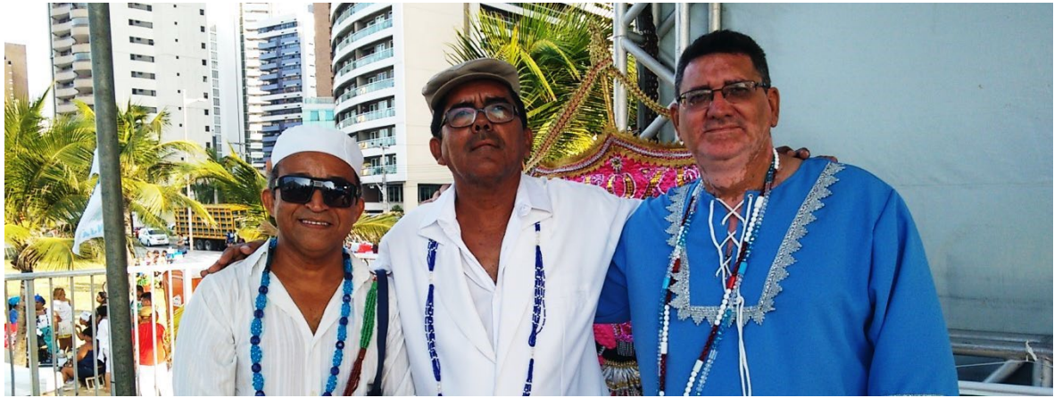
Festa de Iemanjá 2015 no Aterro da Praia de Iracema.