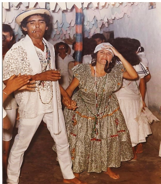
Festa de Preto Velho, Centro Espírita de Umbanda São Miguel, maio de 1984