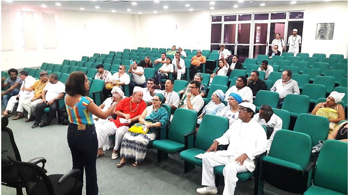
Reunião na Defensoria Pública, combate a Discriminação Religiosa em outubro de 2017.