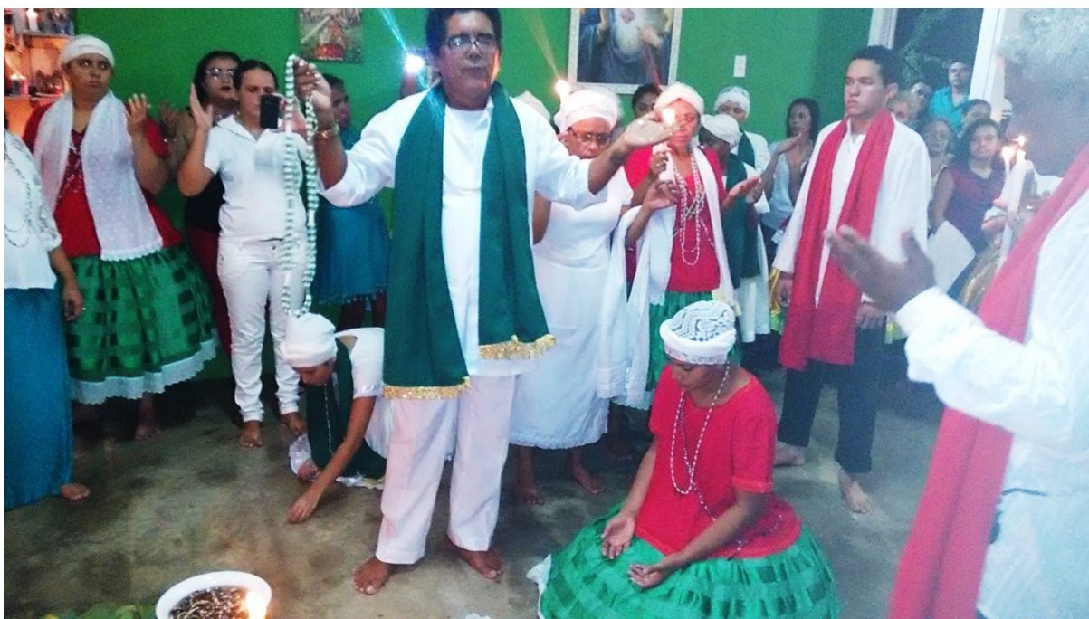
Festa de Caboclo Rei dos Índios, Centro Espírita de Umbanda São Miguel/ 2016.