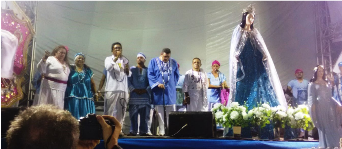
Festa de Iemanjá 2015 no Aterro da Praia de Iracema.