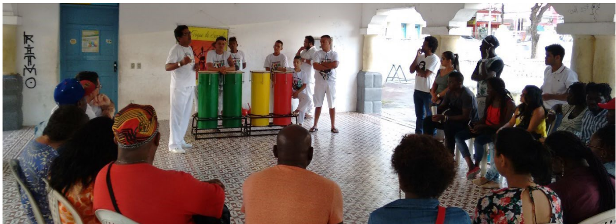
Realização de palestra sobre a Umbanda para estudantes universitários da UNILAB - Universidade Luso-Afro-Brasileira Parque da Criança, Fortaleza, 2015.