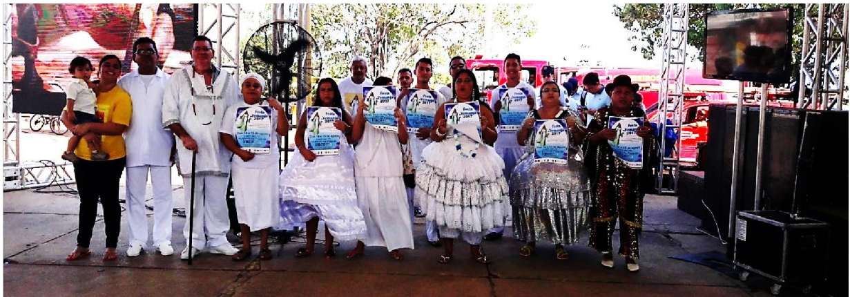
Entrevista sobre a organização e programação da Festa de Iemanjá no aterro da Praia de Iracema, Fortaleza, agosto de 2017.