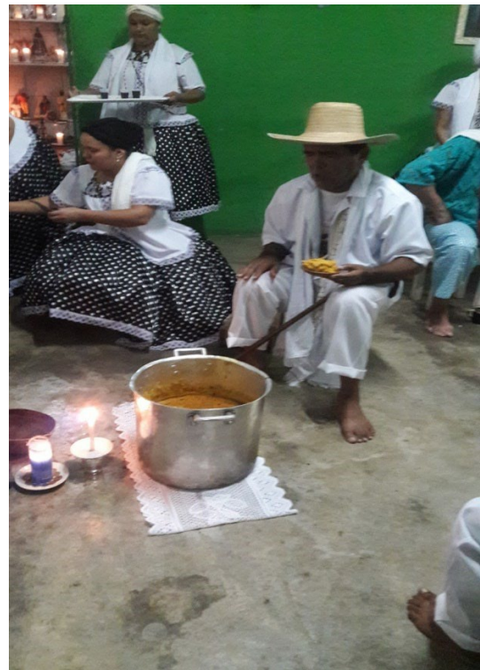
Festa de Preto Velho, realizada no Centro Espírita de Umbanda São Miguel, em em de 2017.