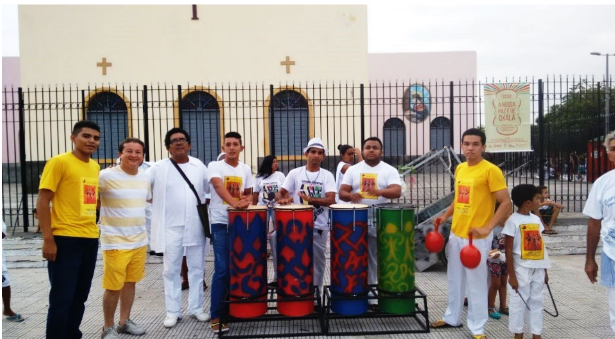
Cortejo Maracatu Solar no carnaval de 2016.