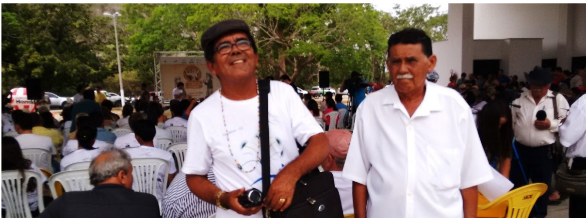
Participação no evento Profetas da Chuva do Ceará, Quixadá, 2015.