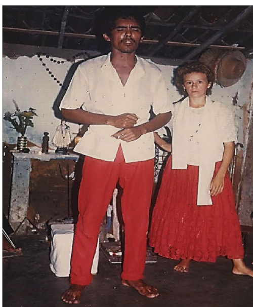
Gira de Ogum no Centro Espírita Umbanda São Miguel, em 23 de abril de 1984.