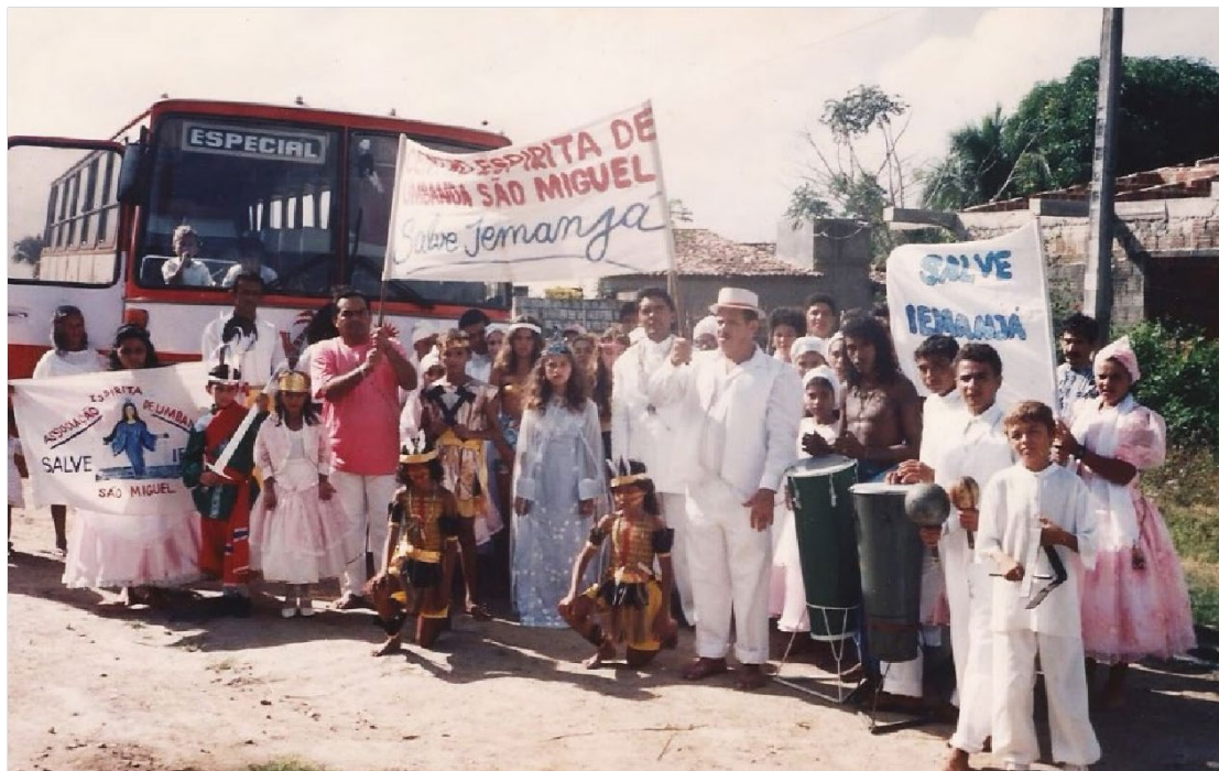
Saída para a Festa de Yemanjá na Praia do Futuro do Centro Espírita de Umbanda São Miguel, 1994.