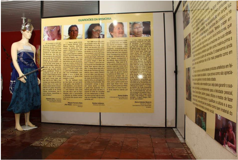
Guardião da Memória do Grande Bom Jardim, Exposição Jardim das Memórias do Ponto de Memória do Grande Bom Jardim, Fortaleza, 2012.