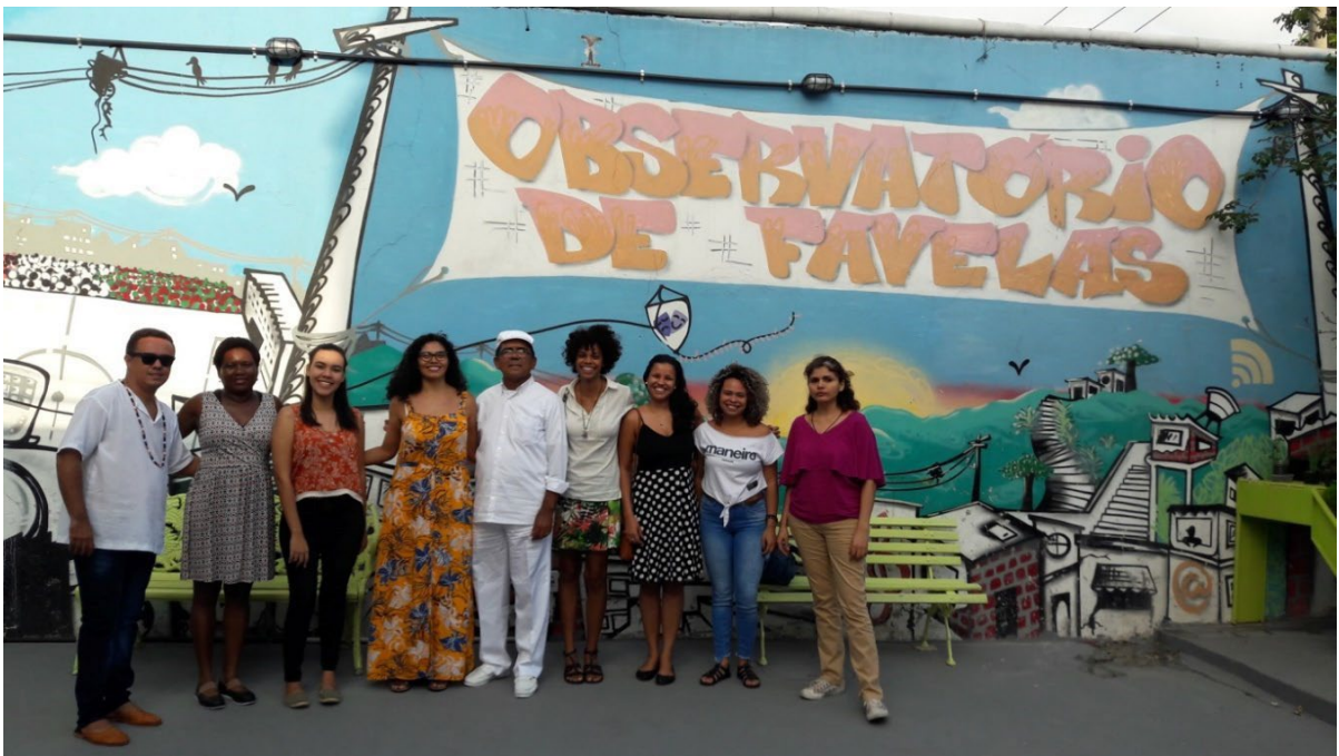
Seminário NEAB/UERJ - Liberdade Religiosa No Brasil realizada no Rio de Janeiro em dezembro de 2017.