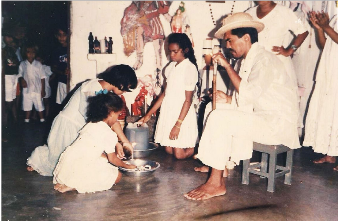
Ritual de Lavagem de Guias na Quarta-Feira de Cinzas, Centro Espírita de Umbanda São Miguel, 04 de março de 1992. (Arquivo Pessoal)