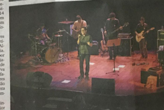
No alto, o músico e poeta Belchior. Em 2016, ele recebeu uma série de homenagens pelo seus 70 anos e 40 anos de "Alucinção", seu segundo álbum. acima, a banda sobralense Trovador Elétrico, interpretando o repertório do compositor