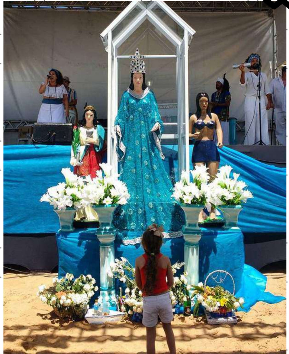
52ª Festa de Iemanjá