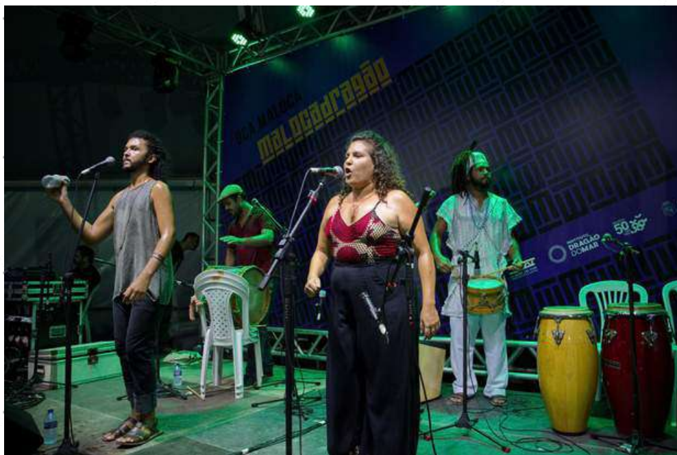
Festival Maloca Dragão 2017

O show "Na Quebrada do Coco" busca trabalhar a diversidade do coco de roda, trazendo diversos sotaques (embolado, coco de praia, coco de terreiro). Num repertório que combina músicas autorais e músicas de mestras e mestres nordestinos (Fortaleza, Iguape, Olinda, Campina Grande, Arcoverde).