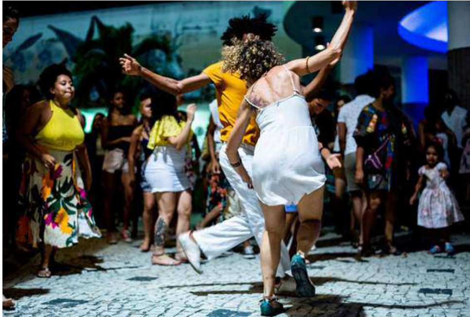
Kitanda Dragão - Temporada de Arte Cearense 2018/19