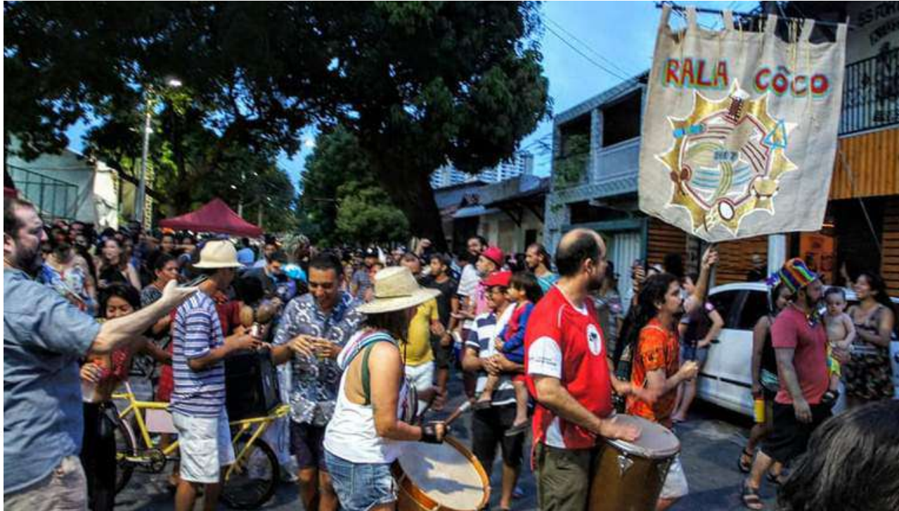
III Bloco Rala Coco

O bloco de carnaval Rala Coco é um brinquedo dos coquistas de Fortaleza. É puxado pelo grupo Na Quebrada do Coco, mas conta com participações de diversos artistas solo ou grupos que têm repertório em coco de roda. É um espaço aberto e gratuito também como forma de fortalecer a fruição do coco em Fortaleza. O bloco acontece de forma itinerante, sendo realizado em sua primeira edição na Avenida Domingos Olímpio, em sua segunda edição no Espaço Cultural Ajeum de Oyá e em sua terceira edição na Praça da Gentilândia. O cortejo do bloco é o convite inicial para a roda de coco que acontece durante 4 horas sempre na segunda-feira de Carnaval. O bloco está em sua 7ª edição.