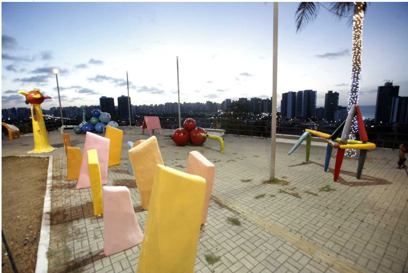
Foram expostos, na Praça do Mirante, modelos de brinquedos/esculturas construídos por crianças de 2 a 12 anos

( HTTPS://PLUS.GOOGLE.COM/SHARE?URL=HTTPS://WWW.FORTALEZA.CE.GOV.BR/NOTICIAS/PREFEITURA-ENCERRA-A-TERCEIRA-EDICAO-DO-PROGRAMA-SER-CRIANCA )