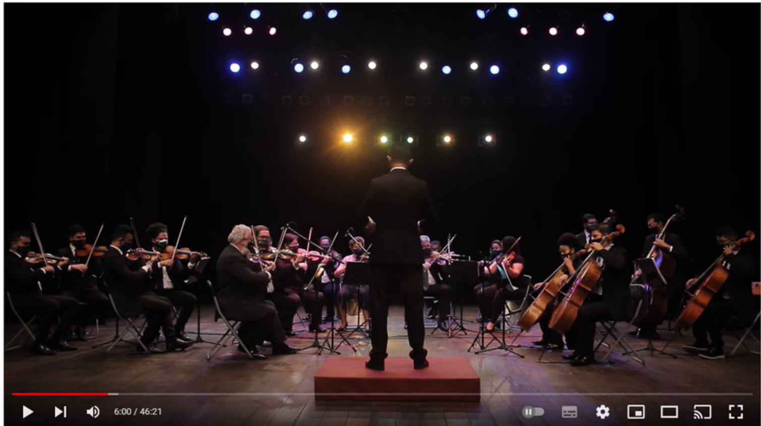
Orquestra Contemporânea Brasileira [Concerto Virtual]