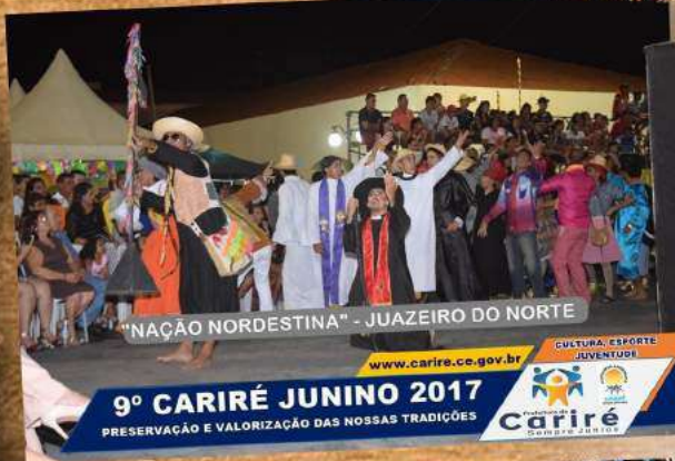
9º CARIRÉ JUNINO 2017 PRESERVAÇÃO E VALORIZAÇÃO DAS NOSSAS TRADIÇÕES