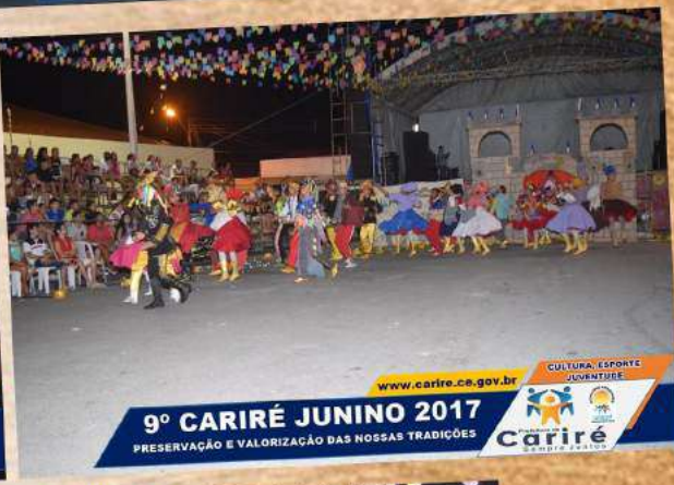
9º CARIRÉ JUNINO 2017 PRESERVAÇÃO E VALORIZAÇÃO DAS NOSSAS TRADIÇÕES