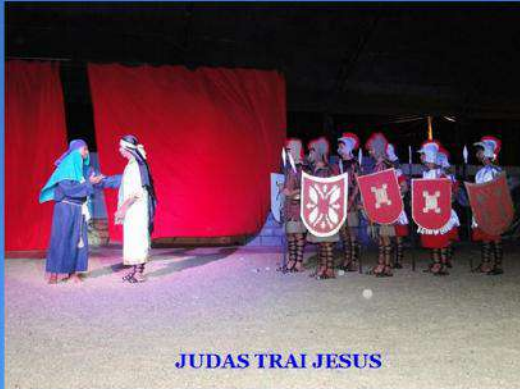
JUDAS TRAI JESUS