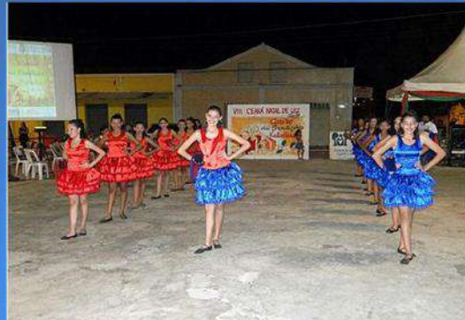
Fatoril Dance Bem, de Cariré, obteve o primeiro lugar no Festival Cariré de Tradições Natalinas