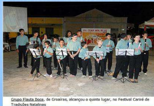
Grupo Flauta Doce, de Groaíras, alcançou o quinto lugar, no Festival Cariré de Tradições Natalinas