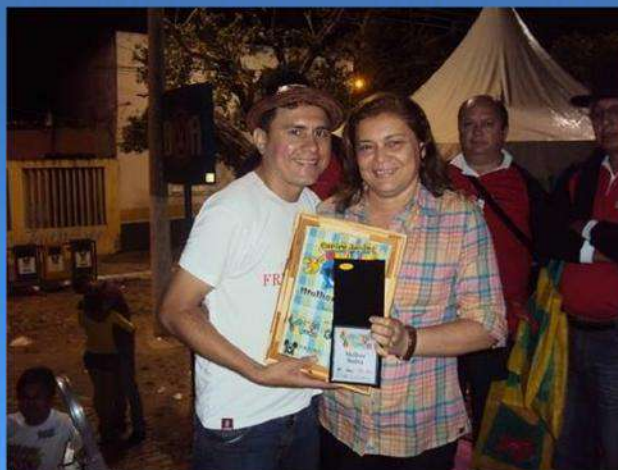
Secretária da Cultura e Turismo de Cariré entrega a premiação ao representante da Melhor Noiva - Pisa na Fulo de Sobral