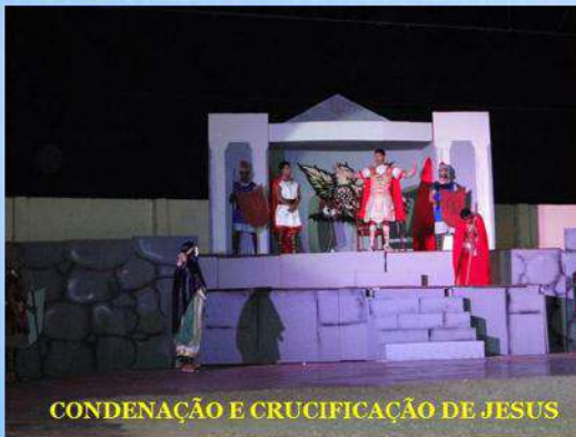
CONDENAÇÃO E CRUCIFICAÇÃO DE JESUS