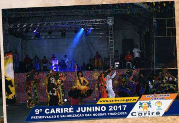
9º CARIRÉ JUNINO 2017 PRESERVAÇÃO E VALORIZAÇÃO DAS NOSSAS TRADIÇÕES