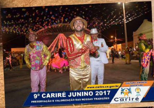
9º CARIRÉ JUNINO 2017 PRESERVAÇÃO E VALORIZAÇÃO DAS NOSSAS TRADIÇÕES