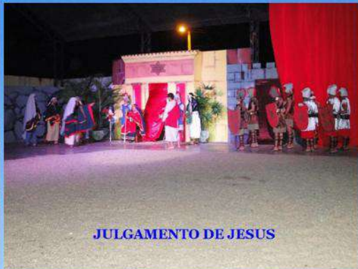
JULGAMENTO DE JESUS