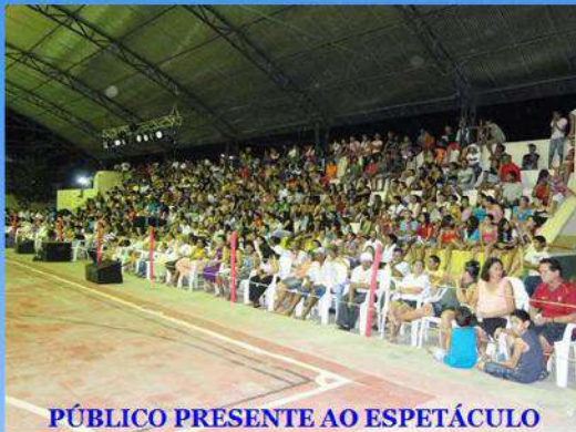
PÚBLICO PRESENTE AO ESPETÁCULO