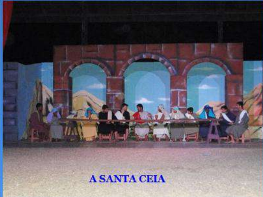
A SANTA CEIA