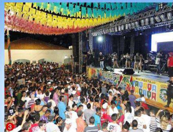
Grande público compareceu à praça da Prefeitura Municipal, para prestigiar a renomada Banda Forró Sacode