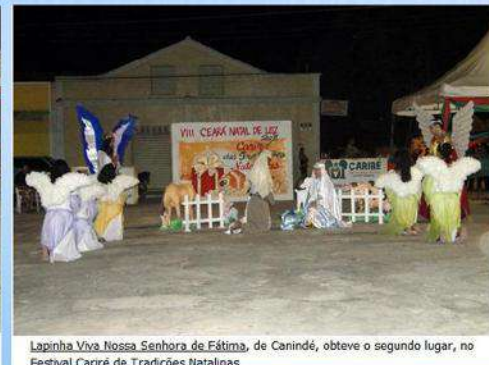
Lapinha Viva Nossa Senhora de Fátima, de Canindé, obteve o segundo lugar, no Festival Cariré de Tradições Natalinas