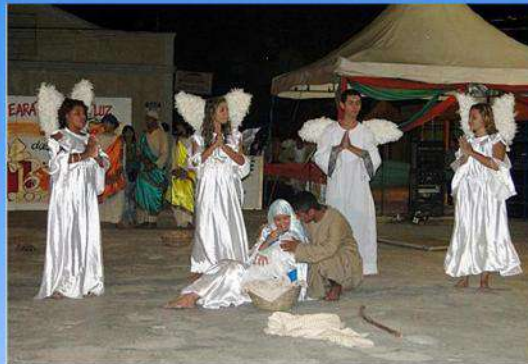
Grupo de Presépio Luar do Sertão, de Varjota, ficou em terceiro lugar, no Festival Cariré de Tradições Natalinas