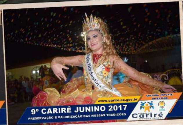
9º CARIRÉ JUNINO 2017 PRESERVAÇÃO E VALORIZAÇÃO DAS NOSSAS TRADIÇÕES