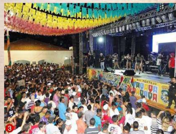
Grande público compareceu à praça da Prefeitura Municipal, para prestigiar a renomada Banda Forró Sacode

10º CARIRÉ JUNINO 2018 "SÃO JOÃO, RAIZ E TRADIÇÃO."