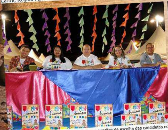
Corpo de jurados da Fequajuce, votou nos quesitos de escolha das candidatas no 10º Cariré Junino de 2018