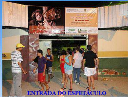
ENTRADA DO ESPETÁCULO